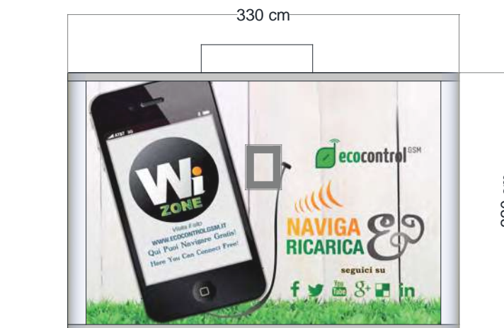
PROSPETTO RICARICA CELL.